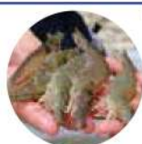
آزمایشات فارمی و بررسی شاخص‌های زیستی حیوان هدف