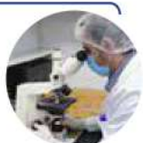
کنترل کیفی محصولات در آزمایشگاه