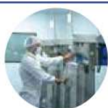
فرمانتاسیون و تولید محصول