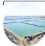
بررسی کیفیت آب مزارع