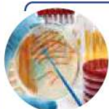
فرایند جداسازی و ارزیابی